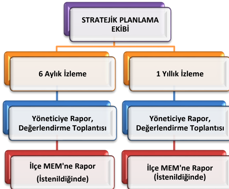
Şekil 2 Stratejik Plan İzleme ve Değerlendirme Modeli

Müdürlüğümüzün 2024-2028 Stratejik Planı İzleme ve Değerlendirme sürecini ifade eden İzleme ve Değerlendirme Modeli hazırlanmıştır. Okulumuzun Stratejik Plan İzleme-Değerlendirme çalışmaları eğitim-öğretim yılı çalışma takvimi de dikkate alınarak 6 aylık ve 1 yıllık sürelerde gerçekleştirilecektir. 6 aylık sürelerde Okul Müdürüne rapor hazırlanacak ve değerlendirme toplantısı düzenlenecektir. İzleme-değerlendirme raporu, istenildiğinde İlçe Milli Eğitim Müdürlüğüne gönderilecektir.